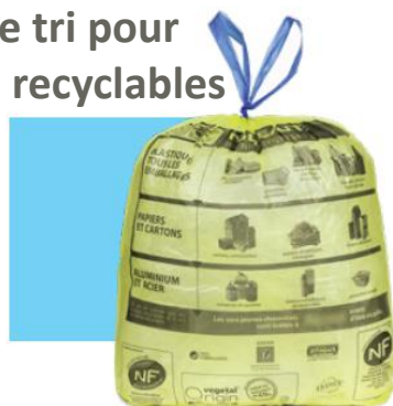
Sac de tri pour déchets recyclables