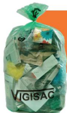
Sac pour poubelles de rue