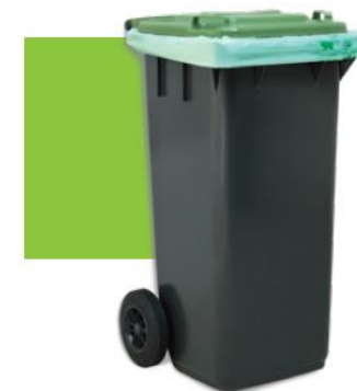
Housse pour conteneurs